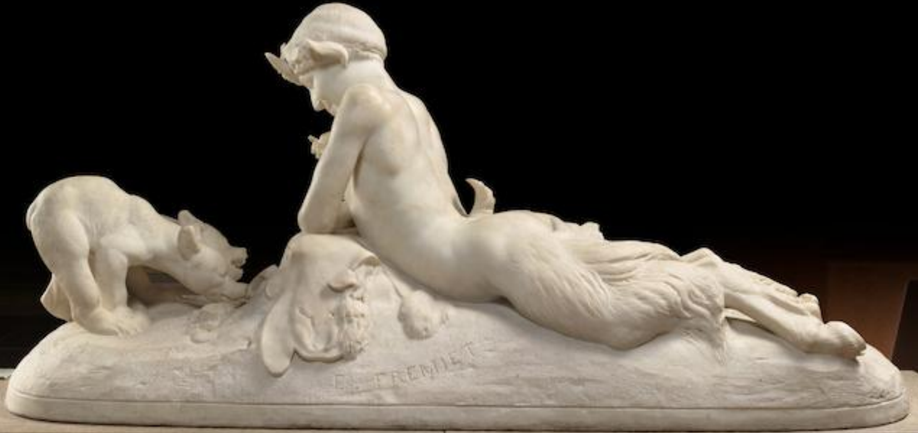
Emmanuel Frémiet (Montrouge, 1824 – Paris, 1910), Pan et oursons , 1867, marbre, Paris, musée d'Orsay.