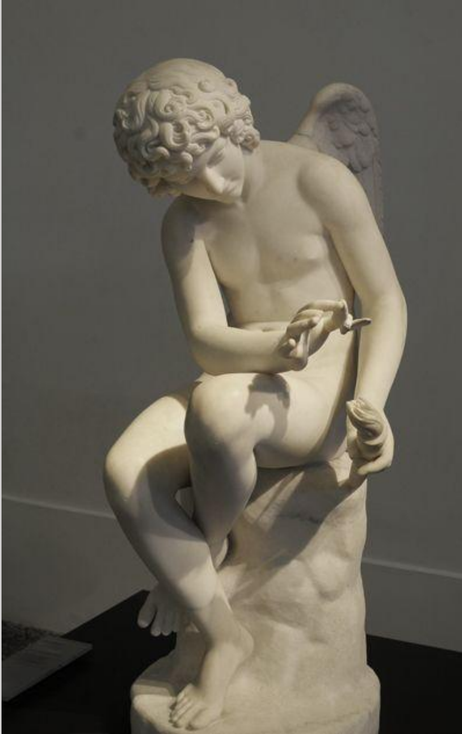
Augustin Dumont (Paris, 1801 – Paris, 1884), L'Amour tourmentant l'âme , 1826/7, marbre, Amiens, musée de Picardie.