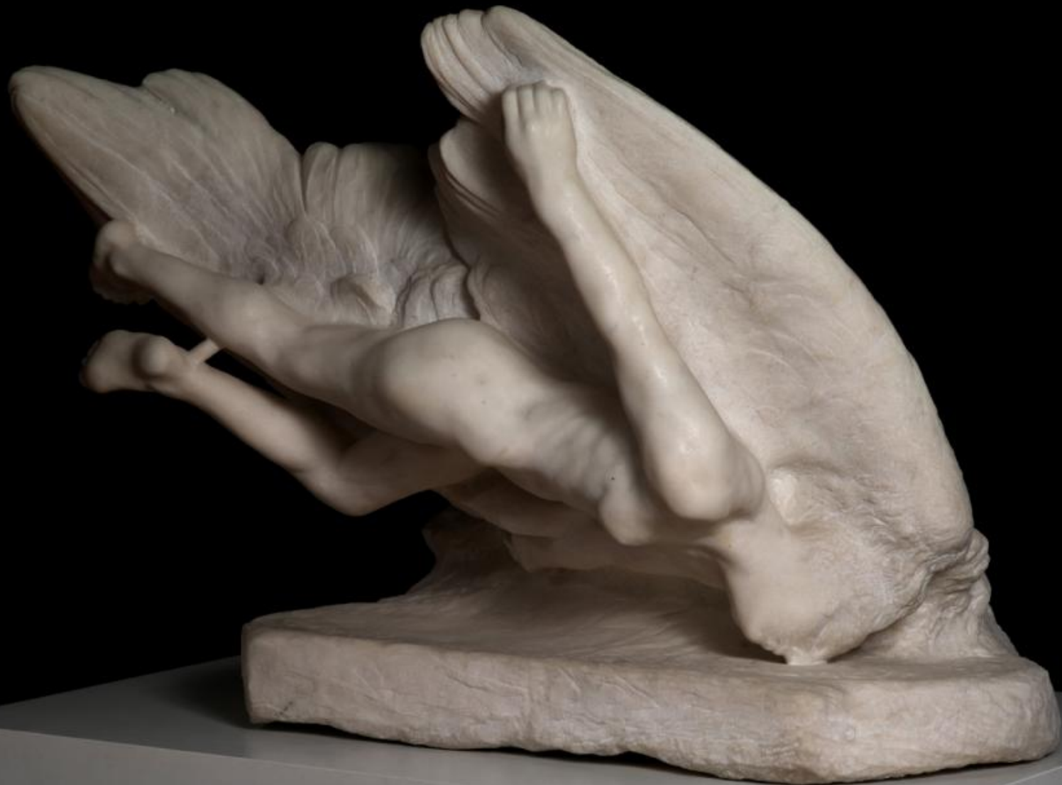
Auguste Rodin (Paris, 1840 – Meudon, 1917), L'illusion, sœur d'Icare , 1894/6, marbre, Paris, musée Rodin.