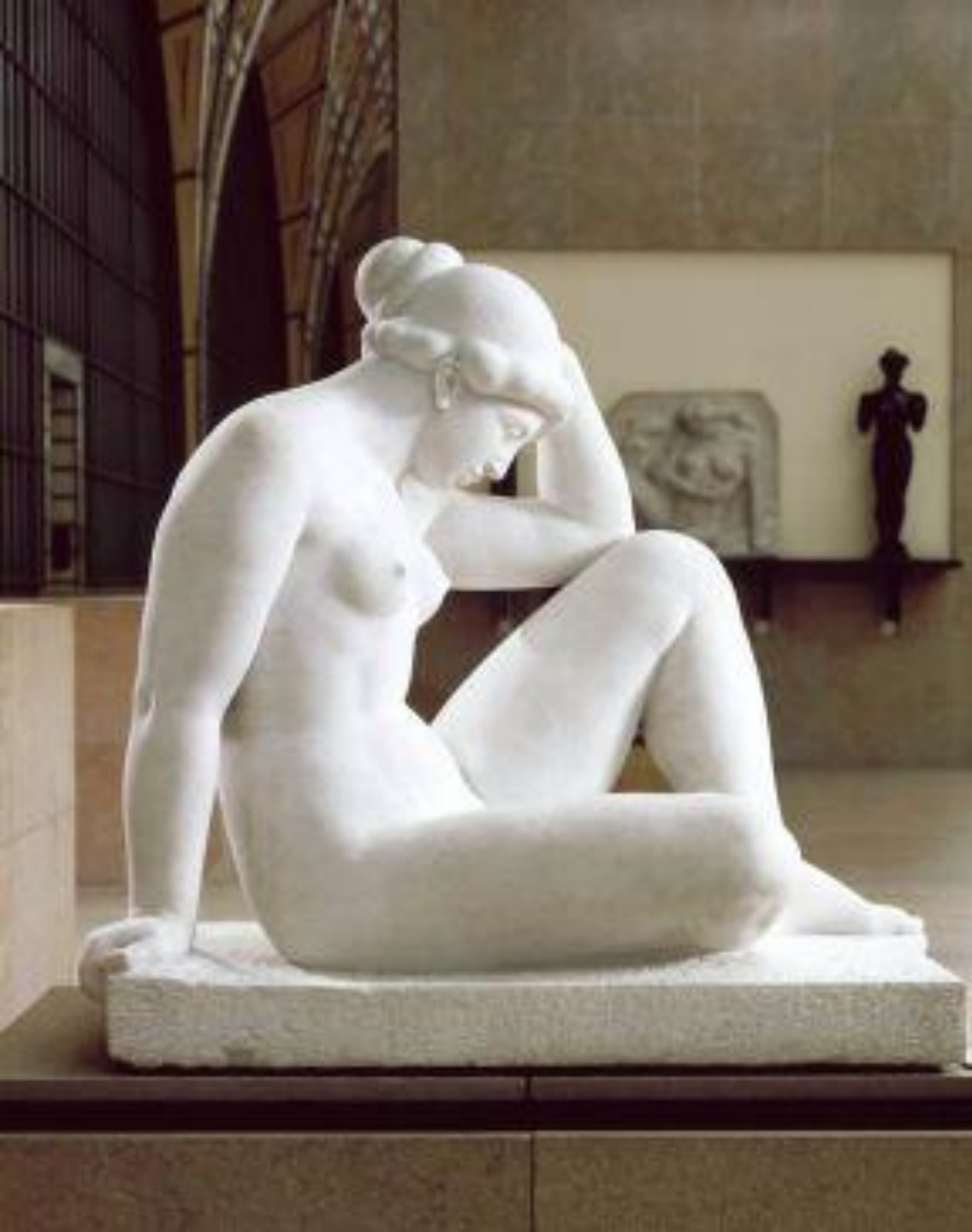
Aristide Maillol (Banyuls-sur-Mer, 1861 – Banyuls-sur-Mer, 1944), Méditerranée , 1923/7, marbre, Paris, musée d'Orsay.