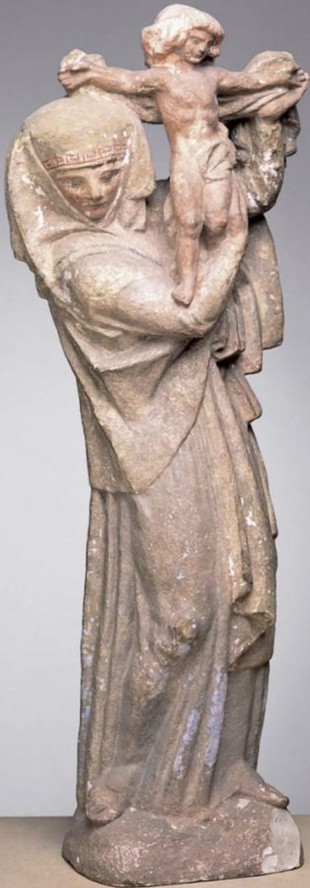
Antoine Bourdelle (Montauban, 1861 - Le Vésinet, 1929), Vierge d'Alsace , vers 1920, plâtre patiné, Toulouse, musée des Augustins.