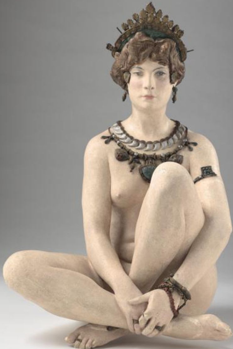
Jean-Léon Gérôme (Vesoul, 1824 – Paris, 1904), Corinthe , 1903, plâtre peint, Paris, musée d'Orsay.