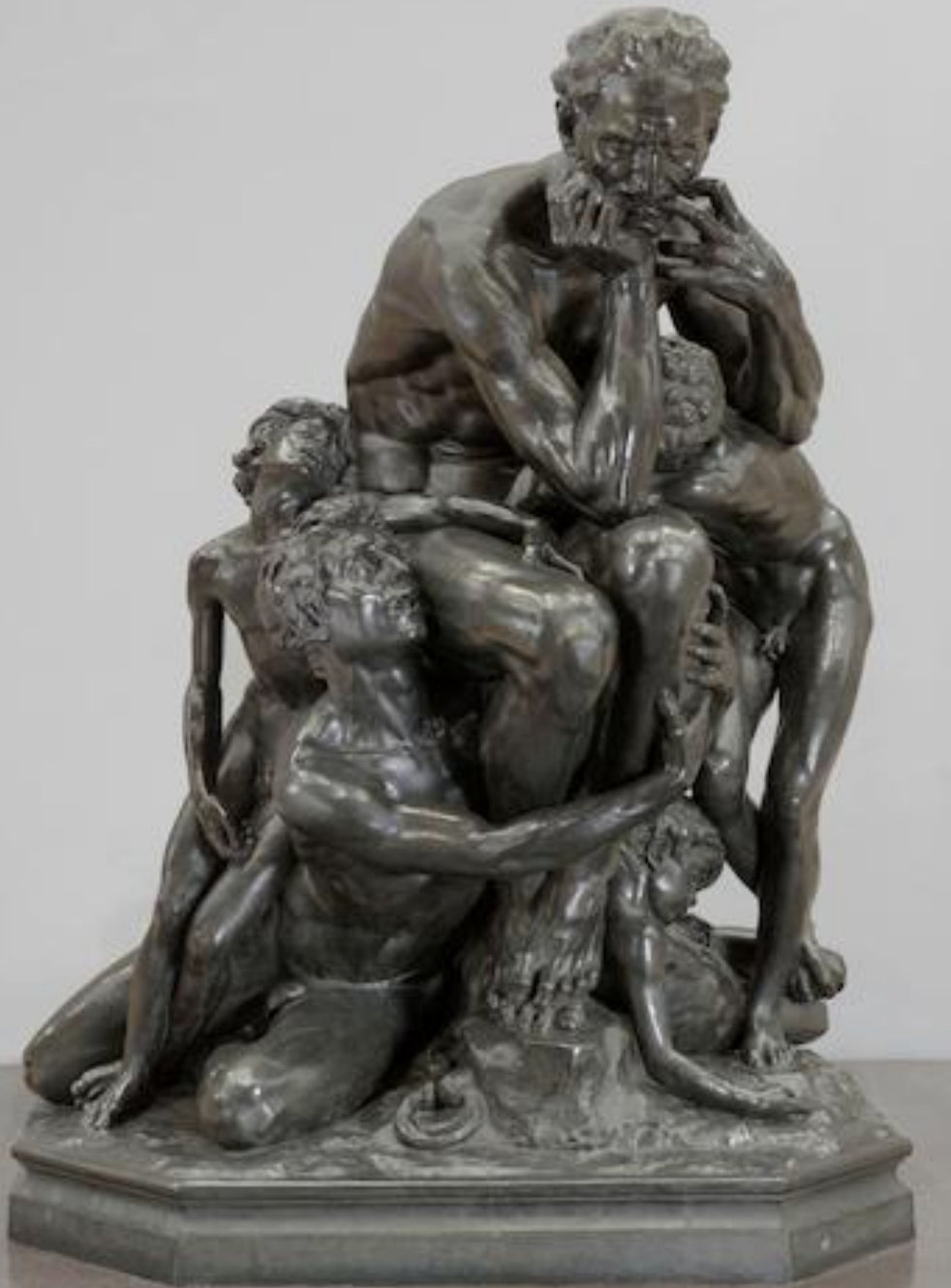
Jean-Baptiste Carpeaux (Valenciennes, 1827 – Courbevoie, 1875), Ugolin , 1863, bronze, Paris, musée d'Orsay.