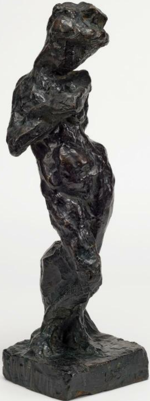
Henri Matisse (Le Cateau-Cambrésis, 1869 - Nice, 1954), Madeleine / 2 , 1903, bronze, Paris, musée national d'Art moderne – Centre Georges-Pompidou.