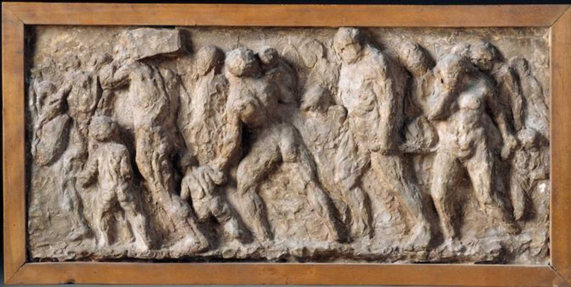
Honoré Daumier (Marseille, 1808 – Valmondois, 1879), Fugitifs , 1848, plâtre, Paris, musée d'Orsay.