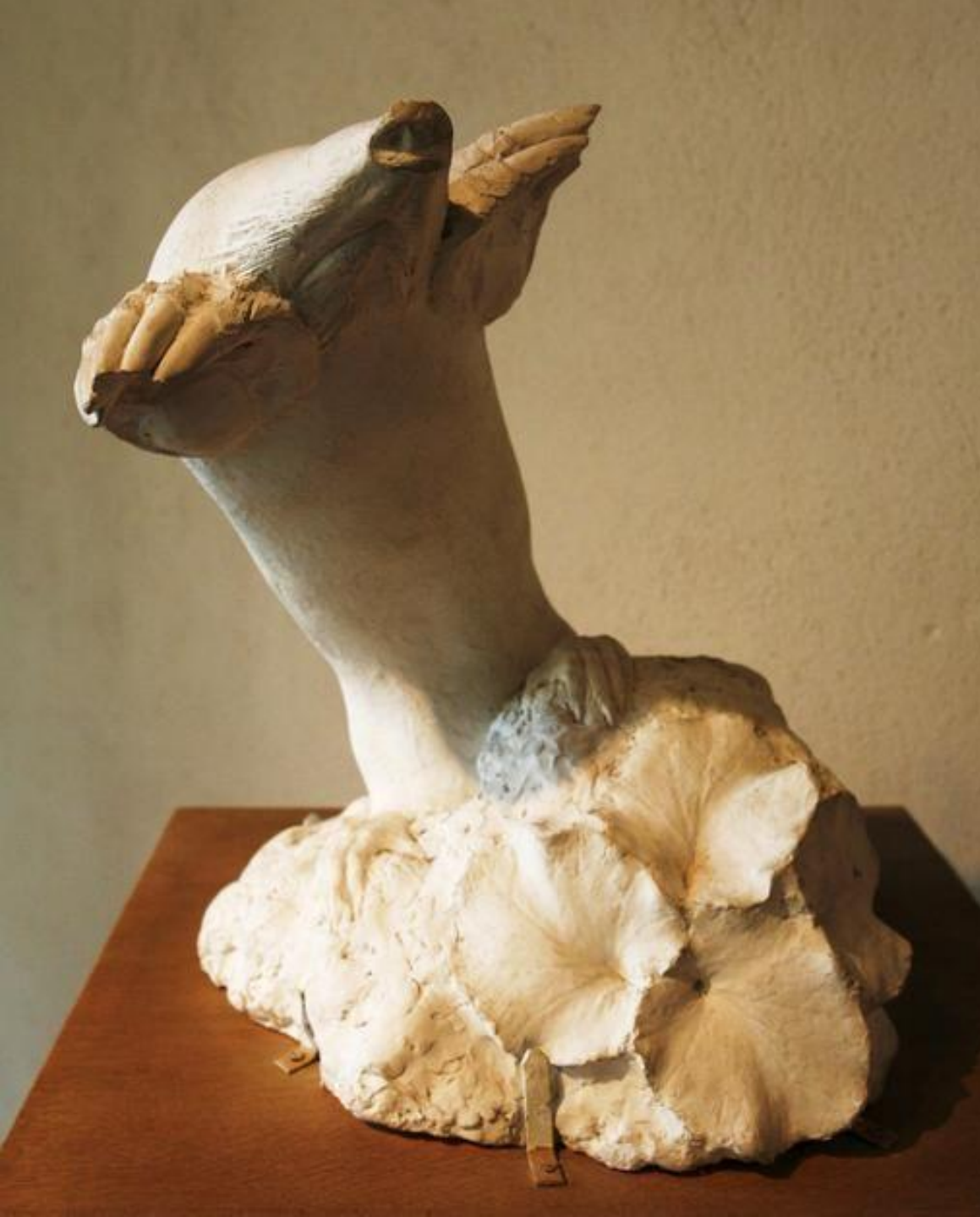
François Pompon (Saulieu, 1855 – Paris, 1933), Taupe , 1908, plâtre, Dijon, musée des beaux-Arts.