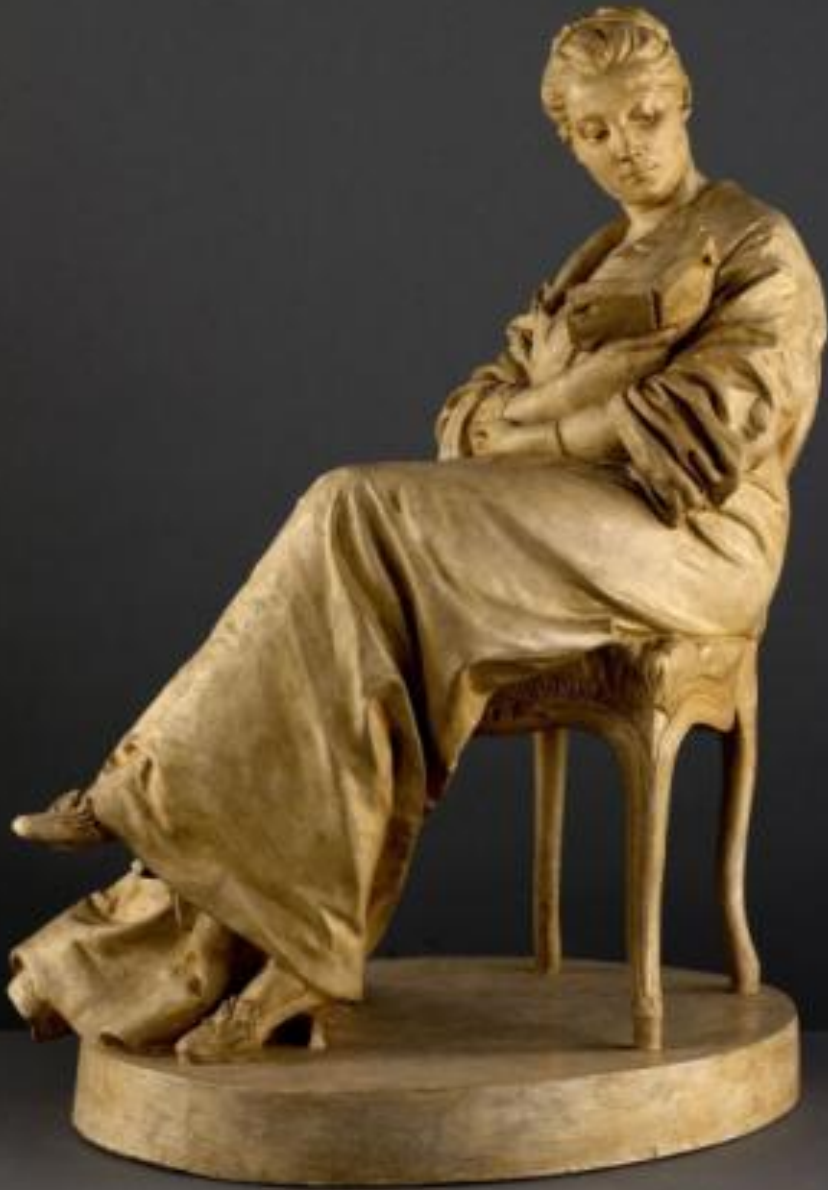
Aimé Jules Dalou (Paris, 1838 – Paris, 1902), La Liseuse , 1877/81, plâtre patiné, Paris, Petit Palais, musée des Beaux-Arts de la Ville de Paris.