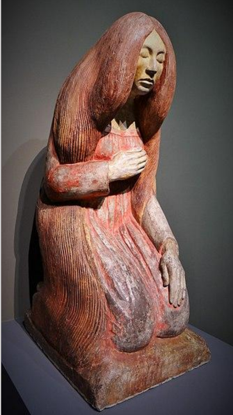
Georges Lacombe (Versailles, 1868 - Alençon, 1916), Marie Madeleine , 1896, plâtre peint, Brême, Kunsthalle.