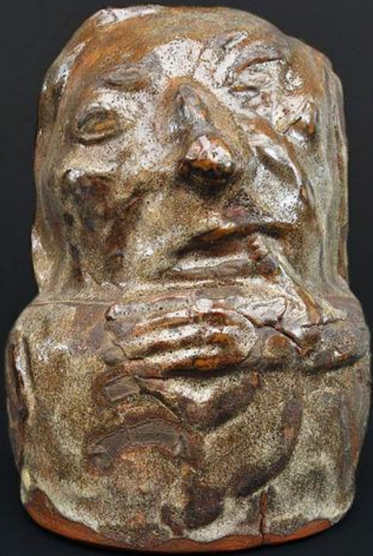
Paul Gauguin (Paris, 1848 – Atuona, 1903), Vase anthropomorphe , 1889, céramique émaillée, Paris, musée d'Orsay.