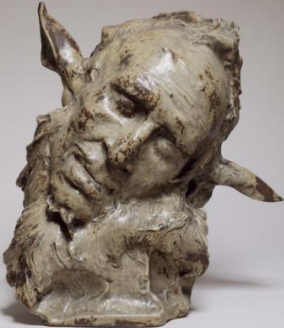
Jean Carriès (Lyon, 1855 – Paris, 1894), Faune , 1890/2, grès émaillé, Paris, Petit Palais, musée des Beaux-Arts de la Ville de Paris.