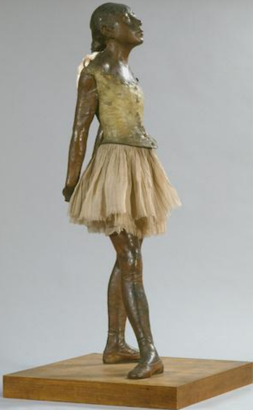
Edgar Degas (Paris, 1834 – Paris, 1917), Petite danseuse de quatorze ans , 1881/1921, bronze, Paris, musée d'Orsay.