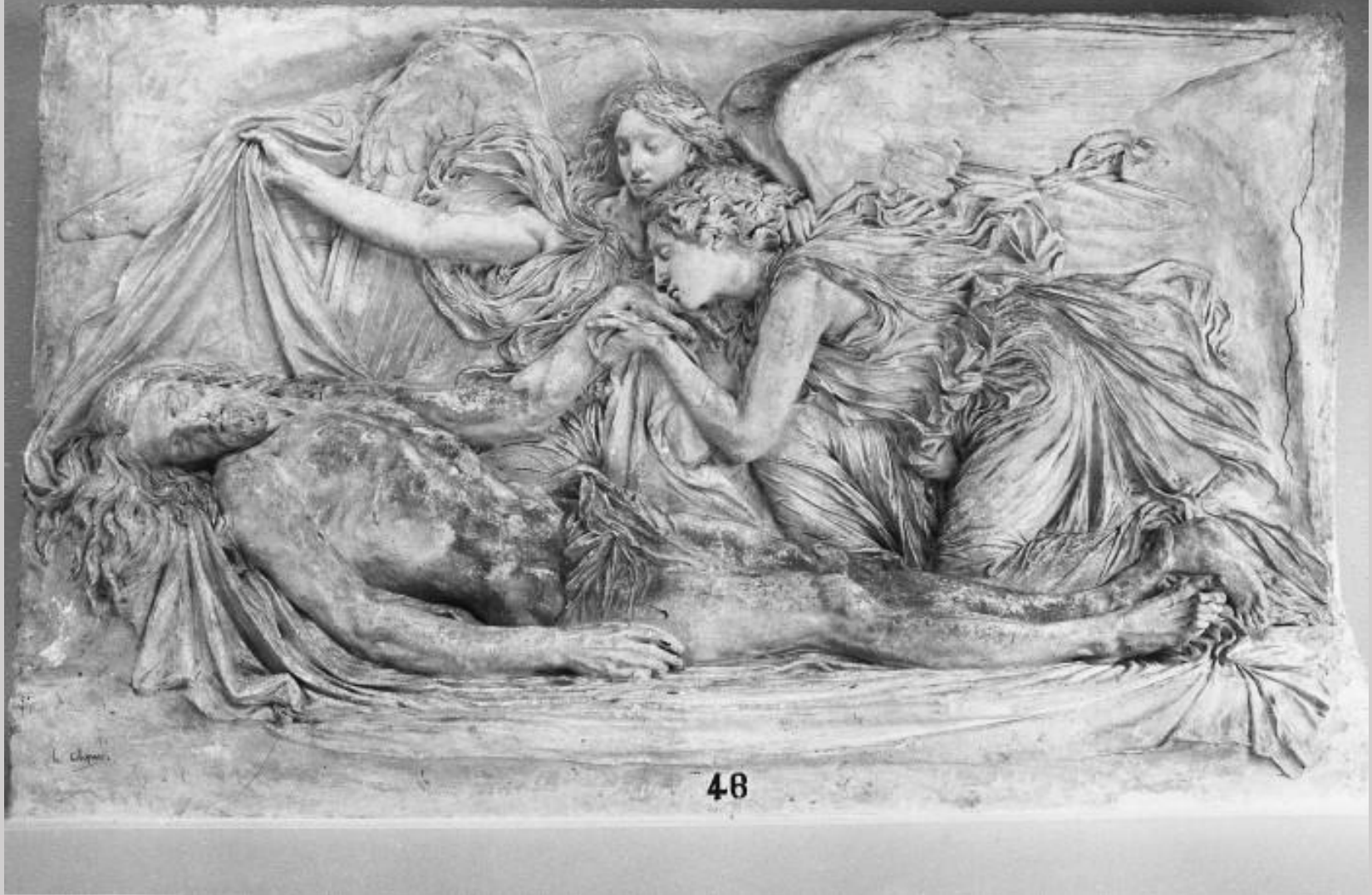
Henri Chapu (Le Mée-sur-Seine, 1833 – Paris, 1891), Le Christ aux anges , 1857, plâtre Le Mée, musée Henri-Chapu.