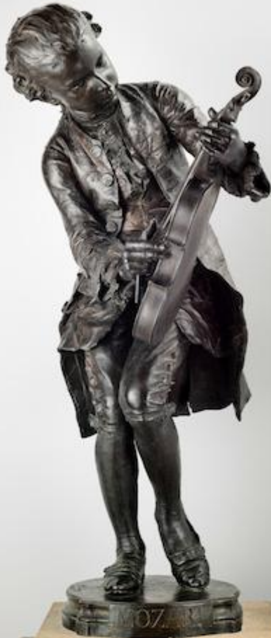
Louis-Ernest Barrias (Paris, 1841 – Paris, 1905), Mozart enfant , 1887, bronze, Paris, Jardin des Tuileries.