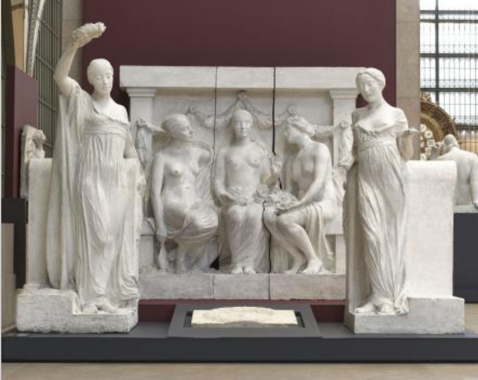
Paul-Albert-Auguste Bartholomé (Thiverval-Grignon, 1848 – Paris, 1928), Monument à Jean-Jacques Rousseau , 1907/12, plâtre, Paris, musée d'Orsay.