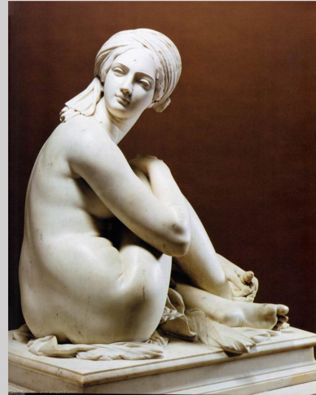
James Pradier (Genève, 1790 - Bougival, 1852), Odalisque , 1841, marbre, Paris, musée du Louvre.