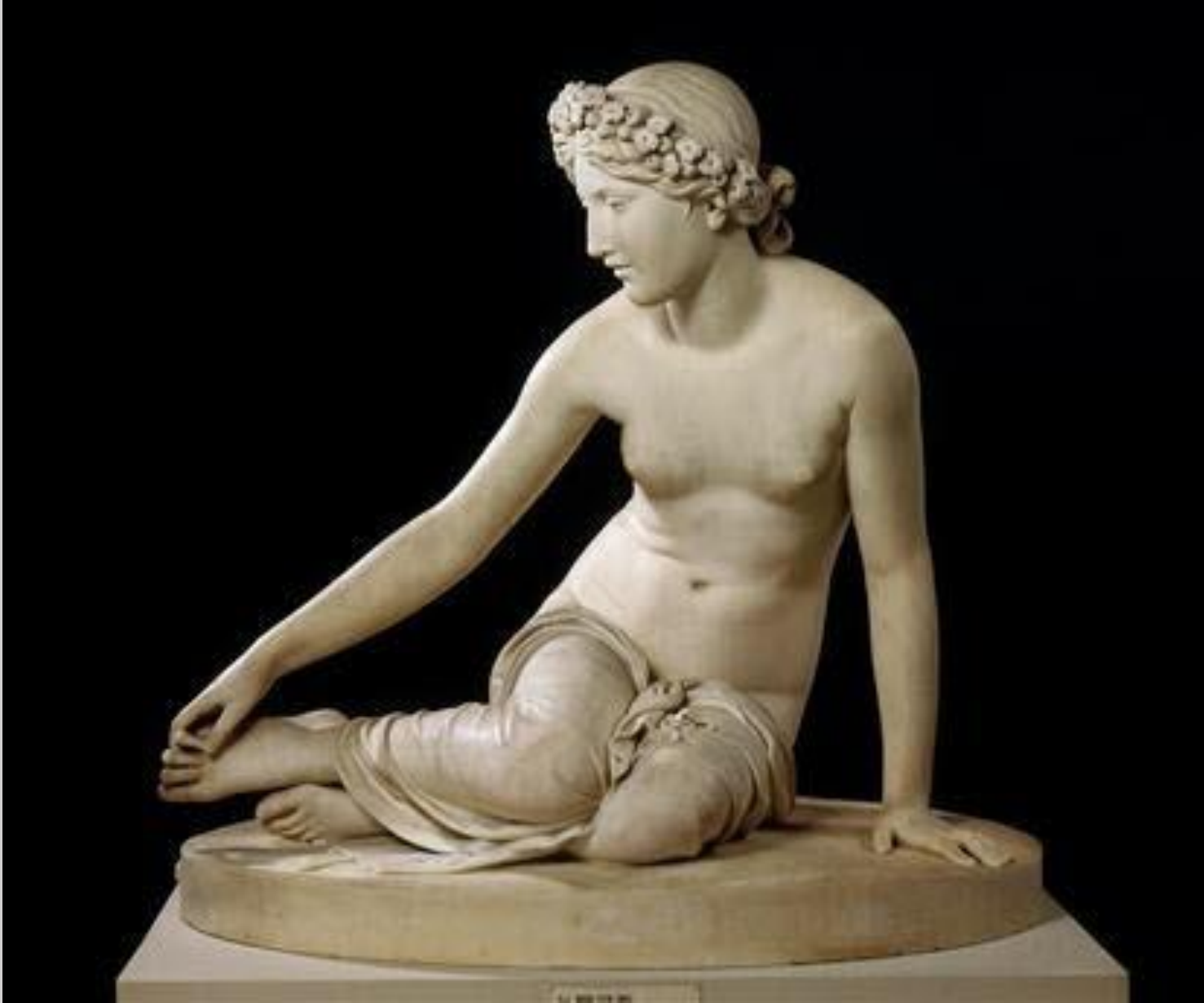
François Joseph Bosio (Monaco, 1768 – Paris, 1845), La Nymphé Salmacis , 1836, marbre, Paris, musée du Louvre.