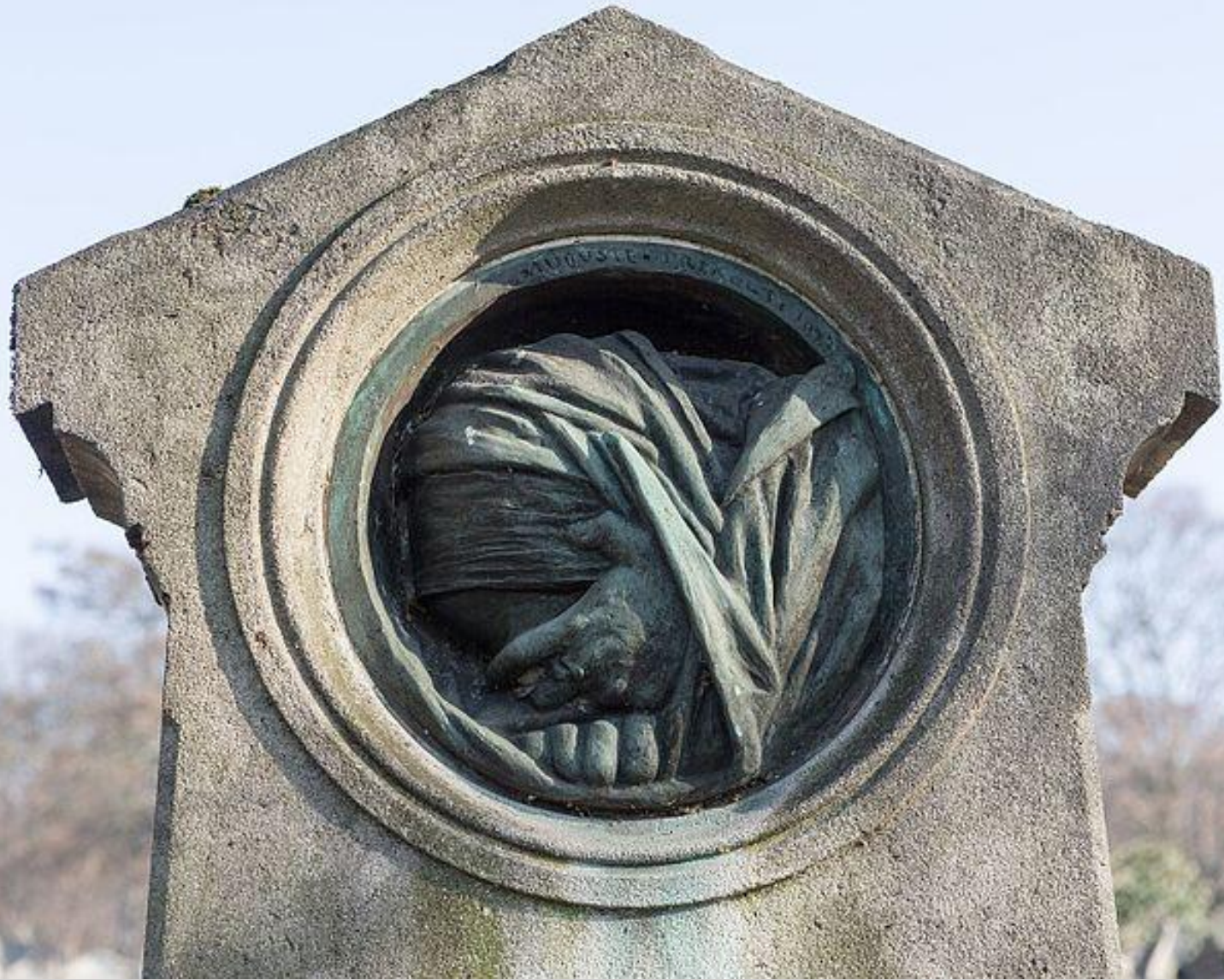
Antoine-Augustin Préault (Paris, 1809 – Paris, 1879), La Douleur , 1873, bronze, Paris, cimetière du Père-Lachaise.