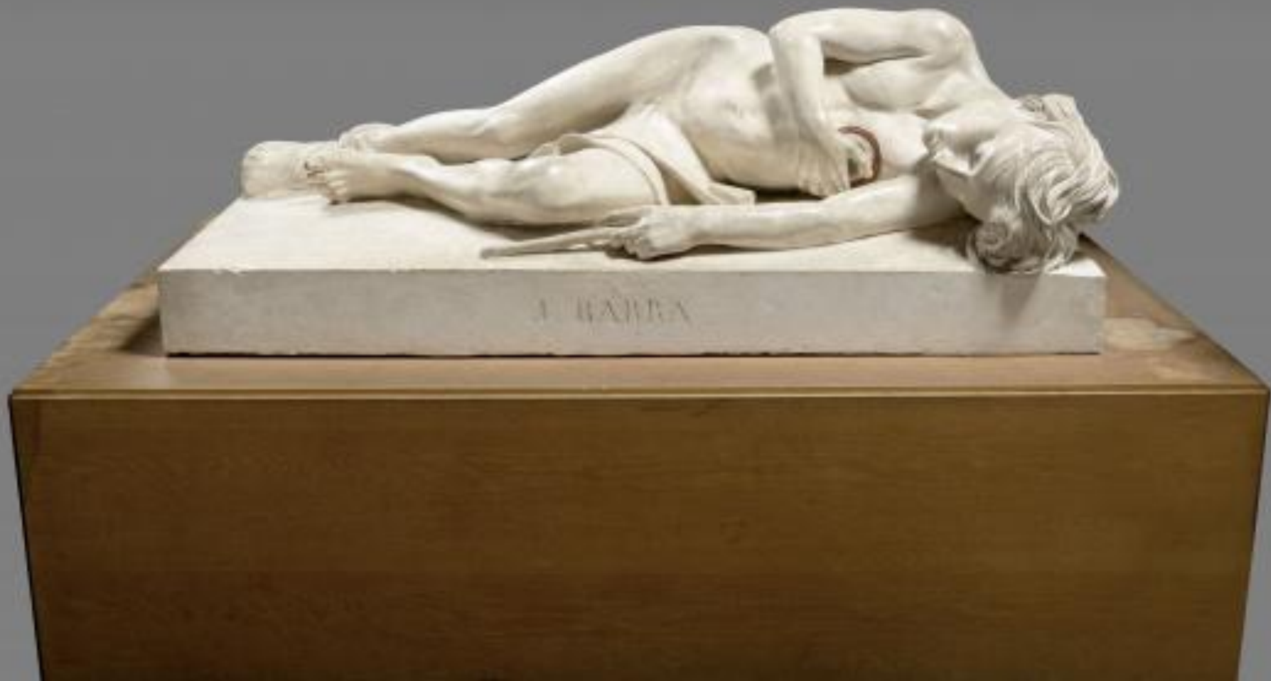
Pierre-Jean David, dit David d'Angers (Angers, 1788 – Paris, 1856), Barra , 1838, plâtre, Angers, musée David-d'Angers.