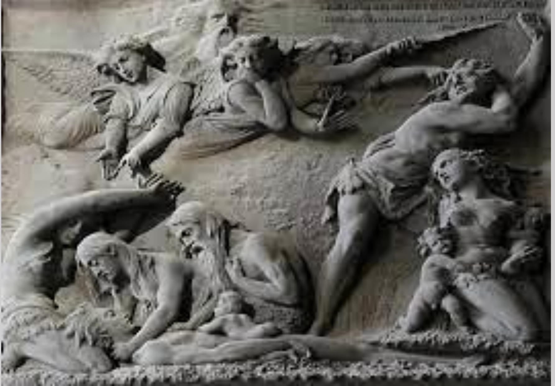
Henri de Triqueti (Conflans-sur-Loing, 1803 – Paris, 1874), Non Occides , 1834/41, bronze, Paris, église de La Madeleine.