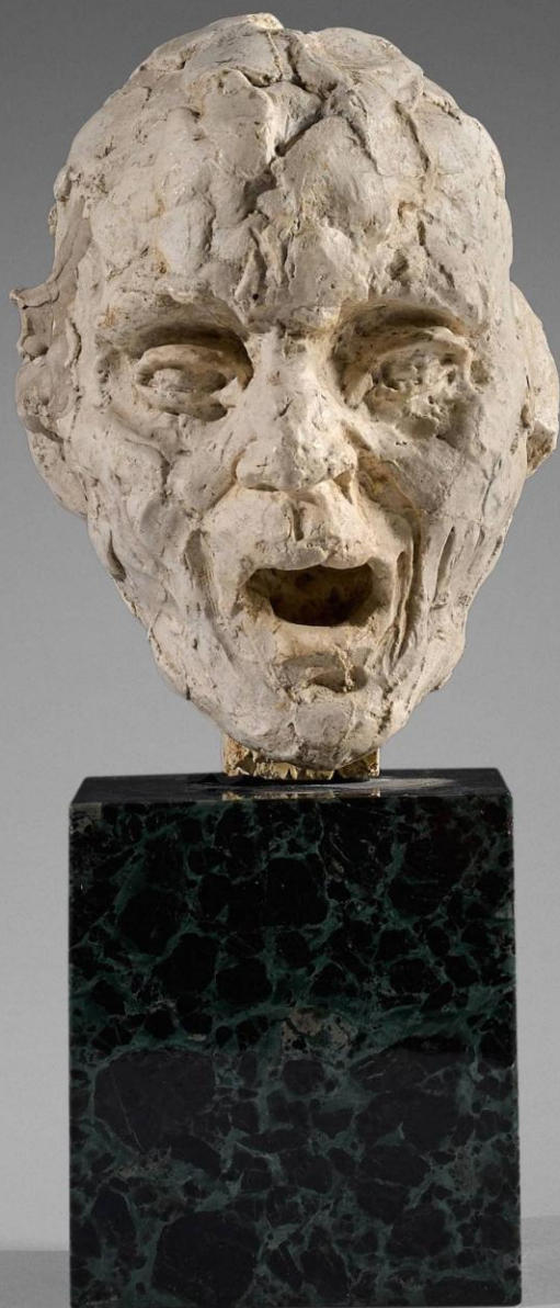
Camille Claudel (Fère-en-Tardenois, 1864 – Montfavet, 1943), Tête de vieille femme , vers 1890, plâtre, Paris, musée d'Orsay.