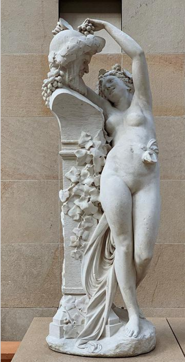
Albert-Ernest Carrier-Belleuse (Anizy-le-Château, 1824 – Sèvres, 1887), Bacchante , 1863, marbre, Paris, musée d'Orsay.