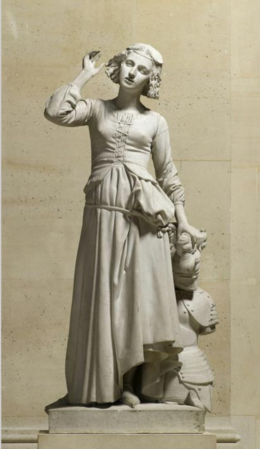
François Rude (Dijon, 1784 – Paris, 1855), Jeanne d'Arc écoutant ses voix , 1852, marbre, Paris, musée du Louvre.